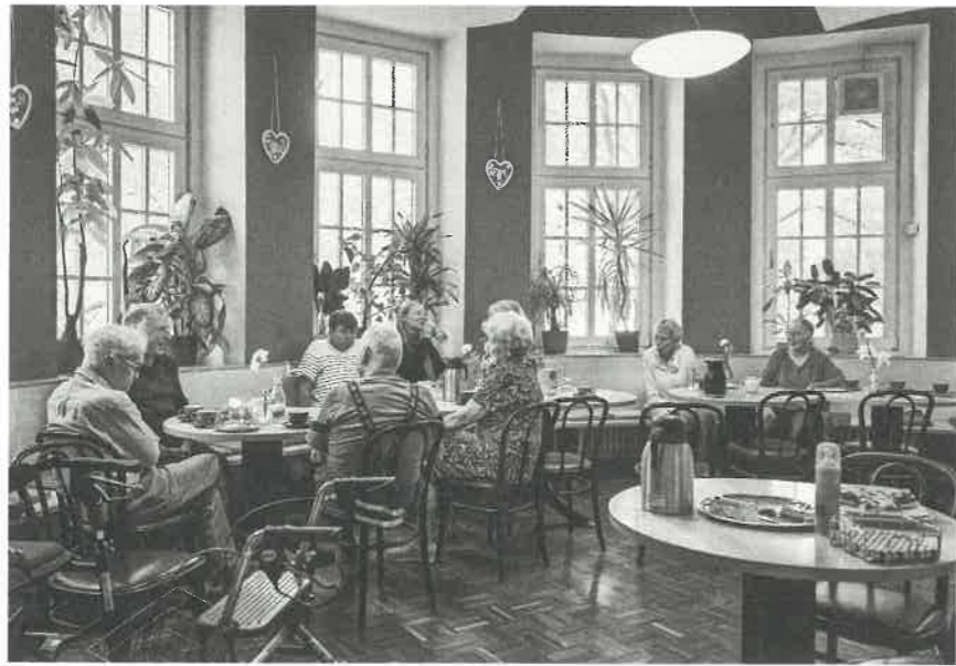
Das Café im Löhe-Haus steht allen Menschen offen.

Stachel, um diverse Bubbles platzen zu lassen“, findet Oliver Gründel. Doch das kulturelle Stadtgeschehen ist alles andere als inklusiv. Denn Menschen mit Behinderung „haben in vielerlei Hinsicht mit Hürden zu kämpfen“, sagt Gründel. Der Diakon führt beispielsweise Vorurteile von Menschen ohne Behinderung und fehlende finanzielle Mittel an. In Werkstätten für Menschen mit Behinderung lassen sich durchschnittlich rund 250 Euro monatlich verdienen. Zu wenig, findet Gründel: „Der Mindestlohn sollte auch für die Menschen in den Werkstätten gelten“, sagt er. Denn das niedrige „Taschengeld“ reiche nicht, um Tickets für Kulturveranstaltungen zu kaufen. Für die Gäste der Party ist der Eintritt frei – insofern sie Tracht tragen.